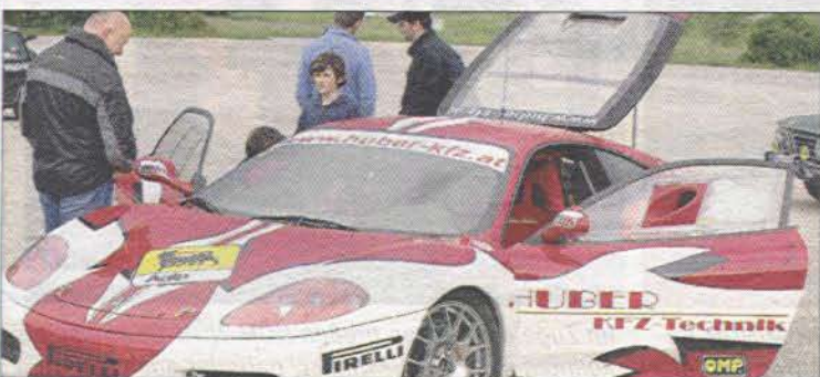
Ein Traum auf vier Rädern. Auch einen Ferrari gab's beim „Classic & Sportscar Testday“ in Teesdorf zu „erfahren“.

Alle Teilnehmer erhielten eine Medaille, eine Urkunde und ein T-Shirt als Belohnung für ihre sportlichen Leistungen.